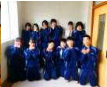
R5年度2学期体育委員