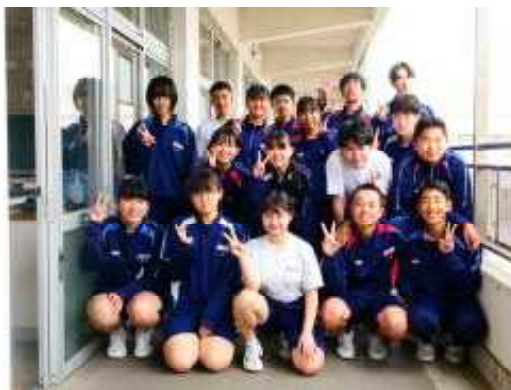
修学旅行実行委員