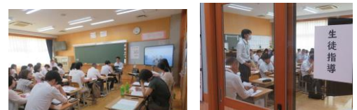
小美玉市研修会 午後は講演会に参加