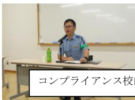
コンプライアンス校内研修も実施