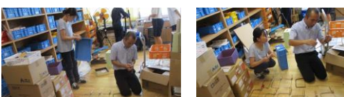
美術室：刃物数などそろっているかの確認 他の特別教室も実施

教職員は、夏休みは、様々な研修に出張していました。また、校内研修も実施しています。研修を行うことで教職員の資質・指導力の向上を図っています。その他特別教室等の備品の確認等も実施し、子供たちが安全に学習に取り組めるよう努めています。