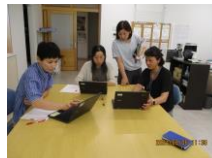
ICTサポーターによる 学びに有効なシステム研修